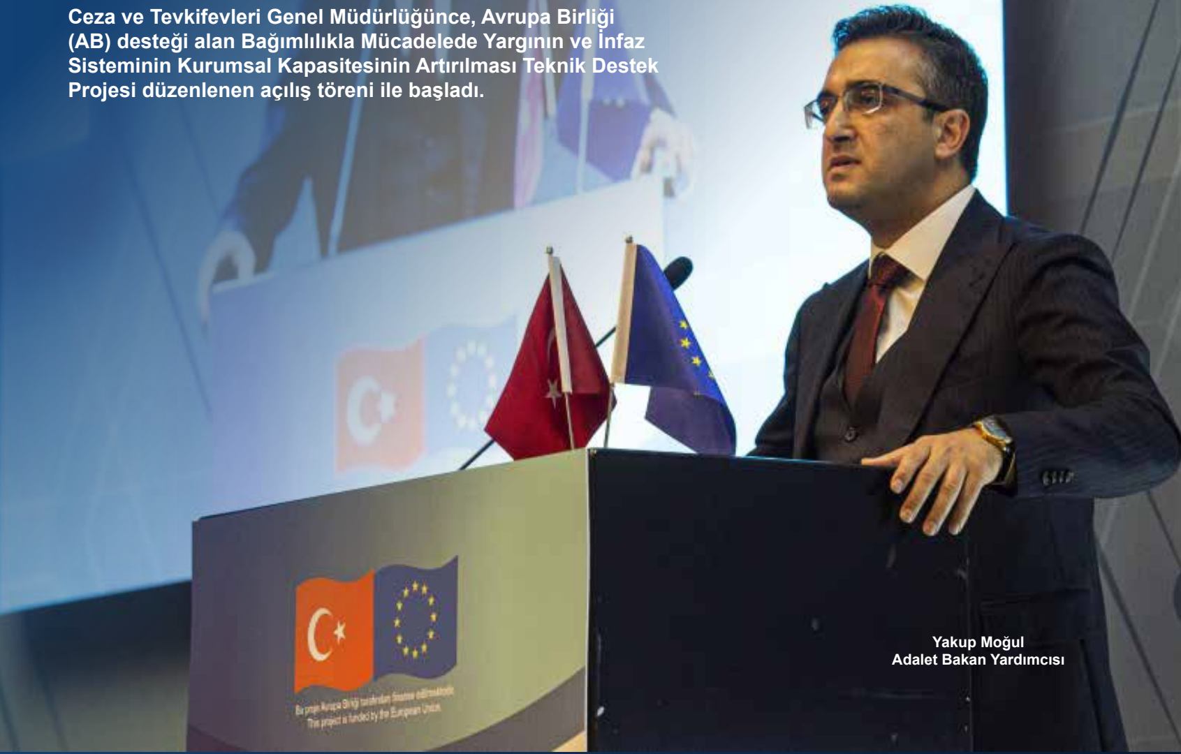
Yakup Moğul Adalet Bakan Yardımcısı

Ceza ve Tevkifevleri Genel Müdürlüğünce, Avrupa Birliği (AB) desteği alan Bağımlılıkla Mücadelede Yargının ve İnfaz Sisteminin Kurumsal Kapasitesinin Artırılması Teknik Destek Projesi düzenlenen açılış töreni ile başladı.